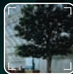
DOPPLER MICROWAVE DATA

Mentre altri rilevatori di movimento si limitano a reagire all'input proveniente da uno o due sensori con una semplice decisione sì/no, i rilevatori Professional Series di Bosch integrano ed elaborano i dati provenienti da un massimo di 5 sensori diversi per consentire la gestione intelligente degli allarmi. L'esclusiva tecnologia di combinazione dati dei sensori adottata da Bosch si avvale di un sofisticato microcontrollore posto all'interno del rilevatore per regolare e bilanciare costantemente la sensibilità di tutti i sensori, assicurando le più accurate decisioni di attivazione dell'allarme mai prodotte.